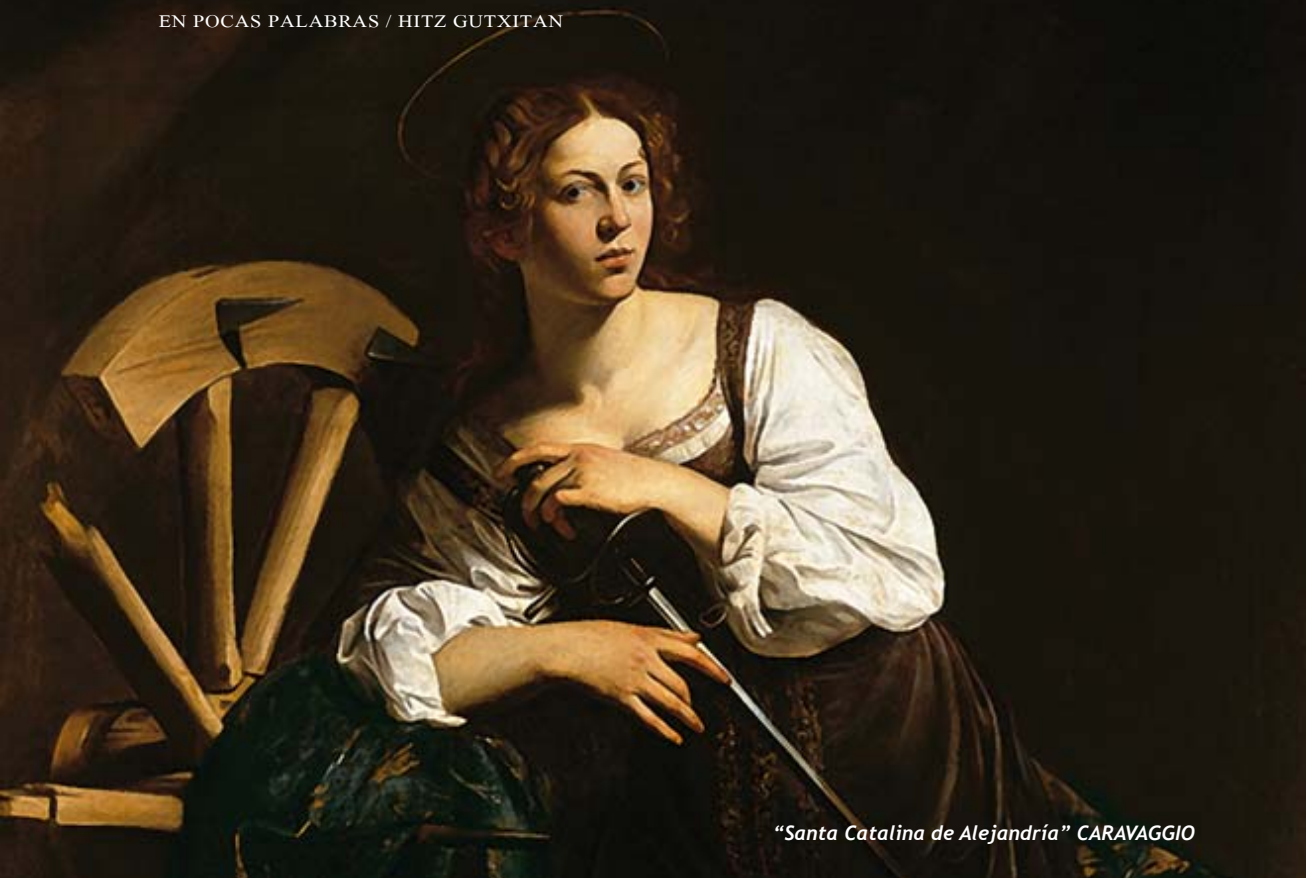
“Santa Catalina de Alejandría” CARAVAGGIO