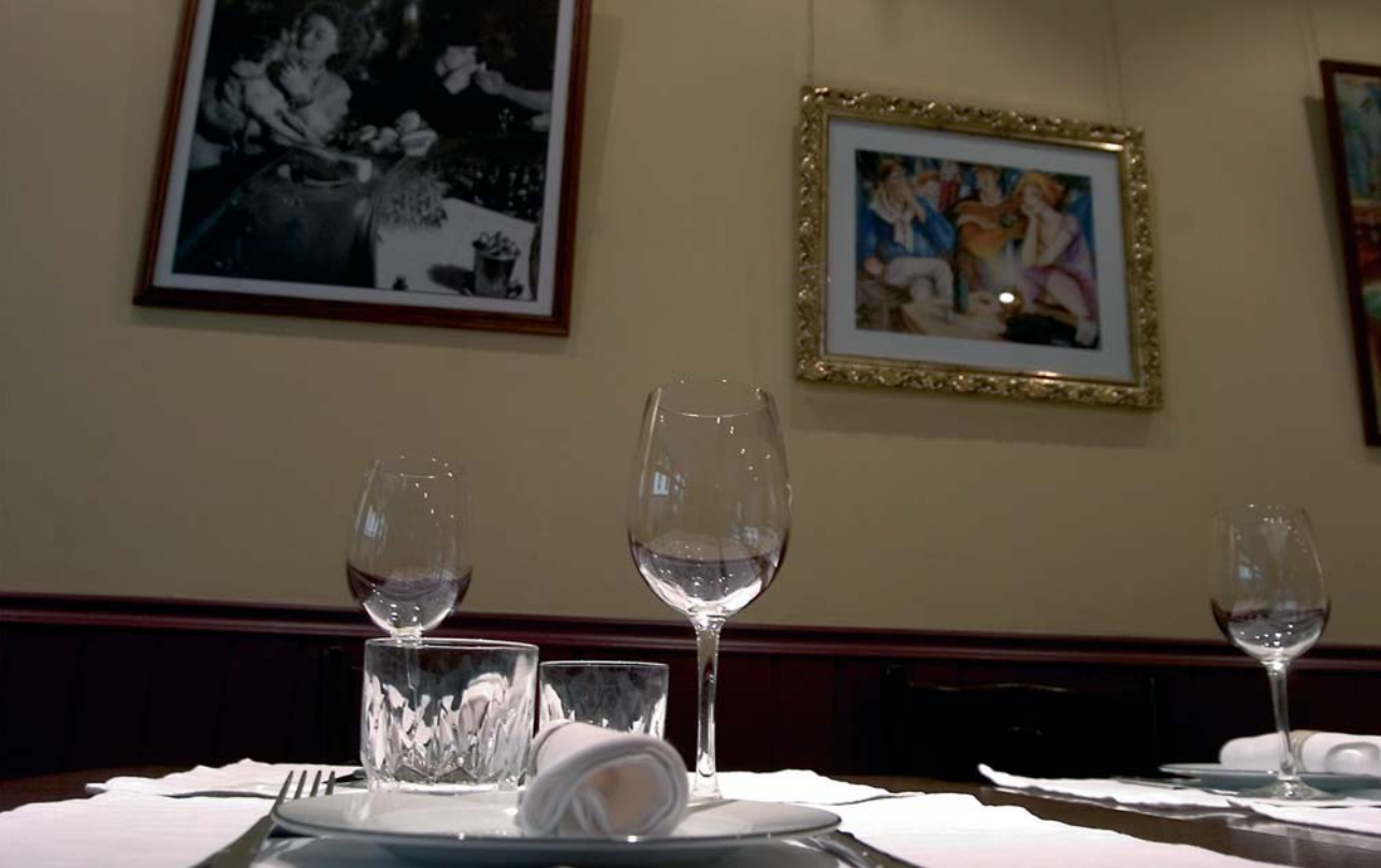
Restaurante A'table: Exposiciones de artistas noveles

que de ellas salen, desde los bares más insospechados hasta los más descarados podemos encontrar decenas de tertulias literarias en las que escuchar, participar, criticar o sugerir. Otros días la invitación es el silencio que solo lo ocupan los versos de algún recitador que esa tarde se expresa en forma de poema y te guía bien hacia la sorpresa bien hacia la indiferencia.