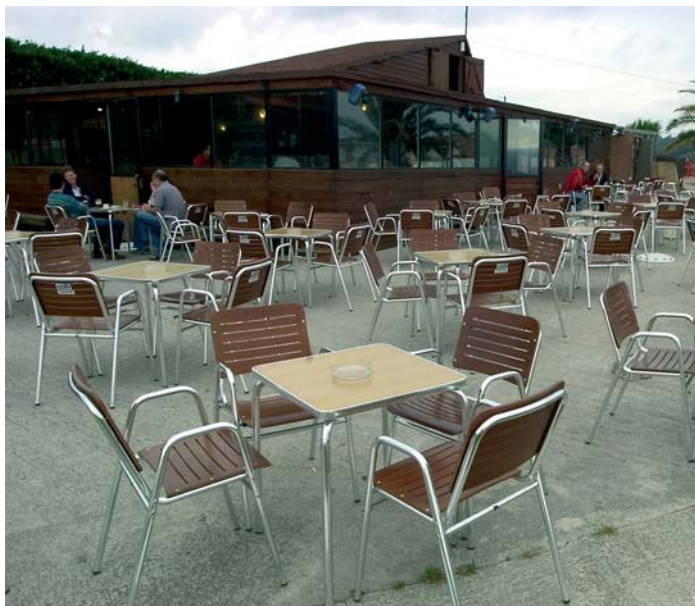
Bar El Golfo Norte, hermosas vistas marinas y conciertos en vivo. Barrica.

Sea con conciertos, con tertulias, con pequeñas representaciones, con ambientes reivindicativos, con partidas al parchis, con exposiciones, o con buena música de fondo, lo importante es, que los espacios se ocupan con un tiempo libre mejor construido, de formas de expresión más sanas y de climas mucho más agradables. F