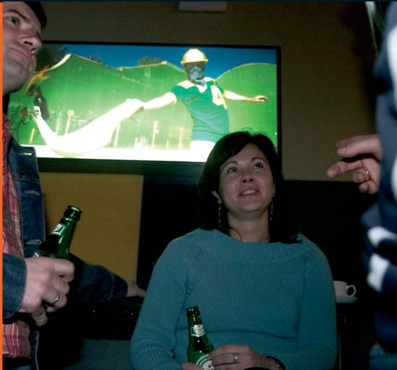
Platervena Durango: Exposiciones, conciertos, teatro, etc.

Algunos locales tienen de especial el "querer quedarse dentro" no sólo para tomar un pote, una copita o un copazo sino también para mantener una charla con música de los 70 pegada al oído, o para escuchar un concierto de lo más ruidoso o un contrabajo de lo más rítmico, o para "tomarte tu tiempo" observado el cuadro que colgado frente a ti te quiere decir algo o nada en absoluto, o mirar las fotos que un desconocido con su reflex y trípode en mano ha sacado a otros desconocidos que sin vergüenza miran fijamente el objetivo.