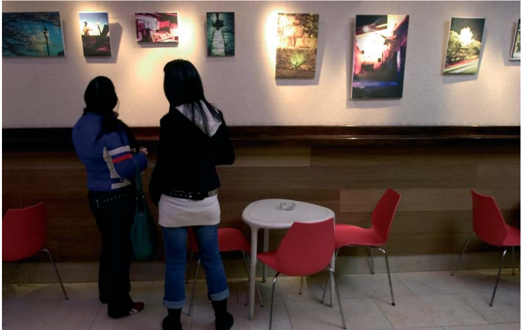
Musutruk en Gernika, ofrece conciertos y exposiciones innovadoras.

cuentro en el que disfrutar, en el que la gente joven y no tan joven, pueda verter sus ganas