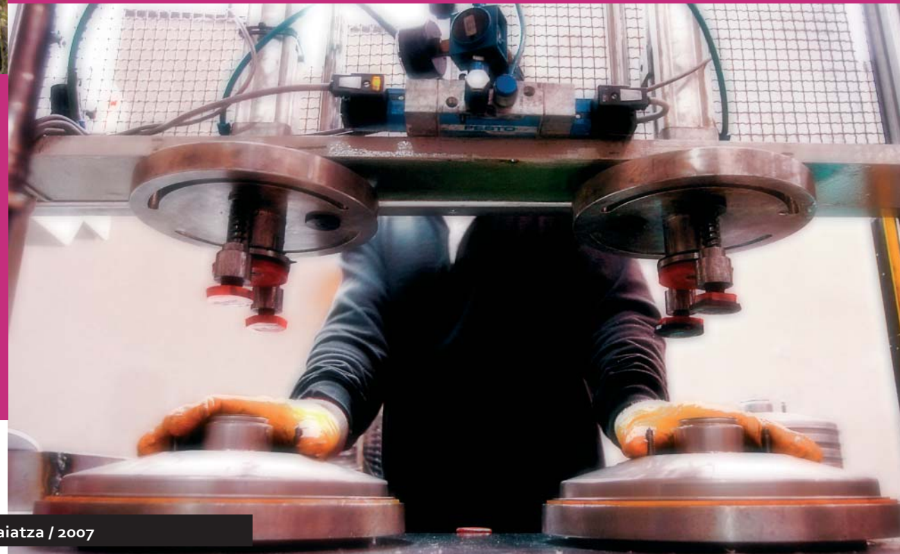
Elektrikari, tubo-egile, fresatzaile, tornulari eta soldatzaile lana egiteko 114 emakume trebatu dituzte.

Ikasketek iraun bitartean, emakumeek diru-laguntza bat