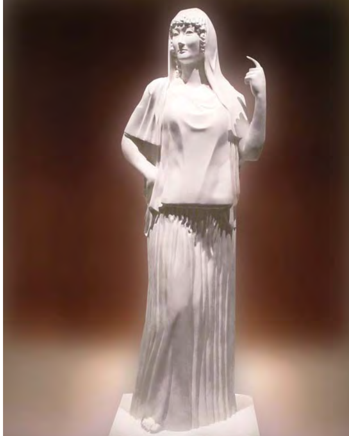
Representación contemporánea de Hestia

Tiene problemas cuando está fuera del entorno de su hogar, pues si su personalidad no está integrada a otros arquetipos que faciliten su sociabilidad, se sentirá desorientada en un mundo que poco valora las