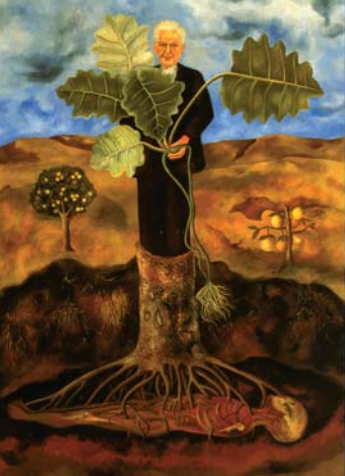
Retrato de Luther Burbank, 1931