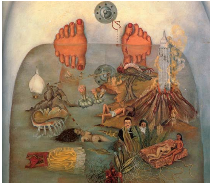
Lo que el agua me dió 1938

Sacudiéndose la inicial imagen de "esposa de pintor", Frida Kahlo creó una nueva imagen de lo femenino. Auténtica y original, exótica e intensa supo desde su compleja y a veces dolorosa historia personal crear una expresión vital y artística que ha influido, fascinado y sobrevivido a las épocas menos propicias para acabar recibiendo un reconocimiento crítico y popular sin precedentes para una mujer artista. F