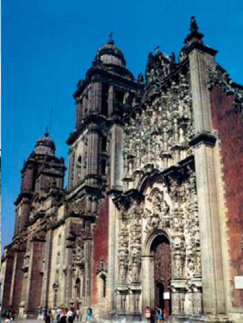
Puebla eta Mexiko D.F hirietako katedralak.