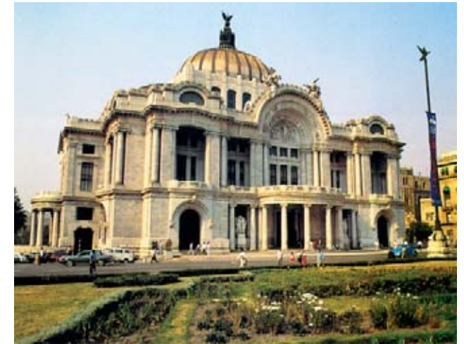
Antropologiako Museo Nazionala eta Arte Ederretako palazioa.

Penintsula honek Mexikoko golkoa Karibe itsasotik banatzen du. Karibeko hondartza turistikoengatik da ezaguna (Cancún, Playa del Carmen, Tulum, Cozumel, Isla Mujeres) baita mayen aurriengatik (Chichén Itzá, Tulum) eta Chicxulub-gatik, zenbait teoriaren arabera, orain dela 65 milioi urte dinosaurusak desagertzeko erantzule izan zen meteoritoa jauzi zeneko gunea. F